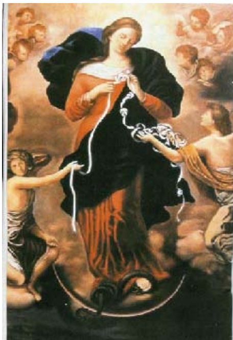
Dipinto venerato nella Chiesa di San Peter Am Perlach di Asburgo (Augsburg) Germania