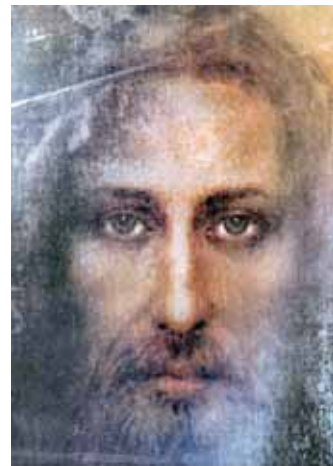
Vero Santo Volto di Gesù

Che si tratti di intellettuali, politici, scienziati, saggisti o nuovi Profeti, insomma chiunque abbia tentato di comunicare attraverso la parola o lo scritto per far comprendere ad altri gli errori di fondo che si commettono nel mondo rimanendo lontano da Dio, è stato silenziato per non disturbare i gruppi di potere, i manovratori dei fili, nel raggiungimento del loro intento diabolico e distruttivo. Mediante i forti poteri a livello laico ed ecclesiale si è riusciti a sabotare, quasi del tutto, qualsiasi pensiero o Rivelazione non conforme.