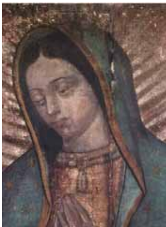
Vero Santo Volto di Maria Santissima Nostra Signora di Guadalupe