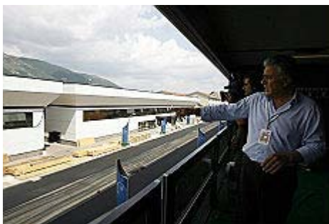
Le nuove palazzine allestite per ospitare le delegazioni all'Aquila

Da oggi gli edifici diventano "zona rossa": nessuno si potrà avvicinare senza pass Mobilitati i militari: 15mila uomini impegnati. E dai cieli vigilerà un Predator dal nostro inviato JENNER MELETTI